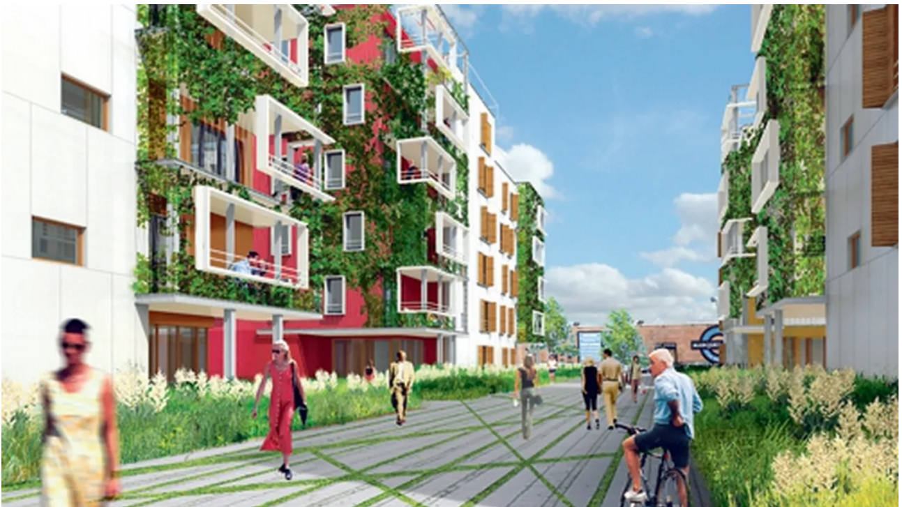
L'écoquartier : Projet urbain viable et durable ou considérations utopistes ?